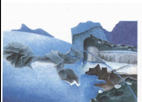
Civiltà del Mediterraneo